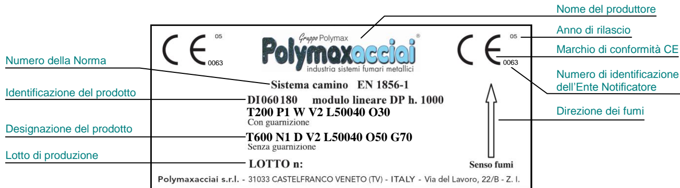
Esempio di etichetta posizionata sul prodotto